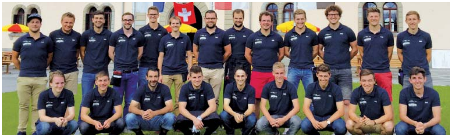
Helferteam Festwirtschaft 1. August Feier 2016.