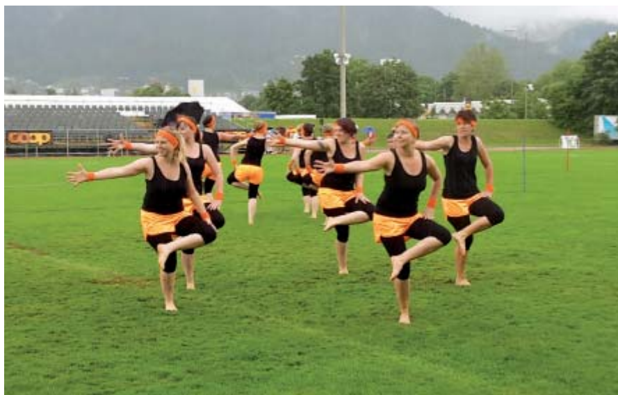
Gymnastik Kleinfeld mit neuem Programm.