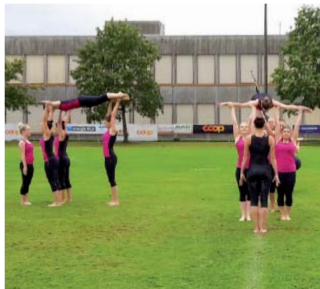
Gymnastik Grossfeld.