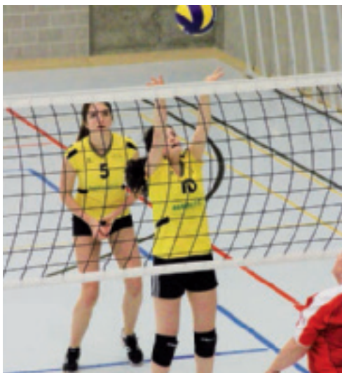
Teufen 4 will hoch hinaus.

In seiner pragmatischen und lösungsorientierten, aber vor allem immer menschlichen Art und Weise findet er immer Wege, seine Jungs durch den Fussball zu begleiten. Wir wünschen Hans auf diesem Weg Kraft, Gesundheit und den Idealismus, den es braucht, um die persönlich gesteckten Ziele zu erreichen. Der Vorstand des FC Teufen