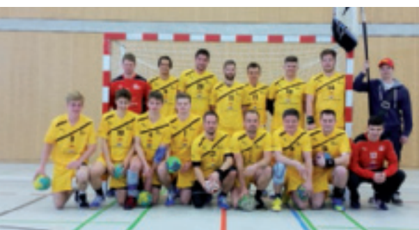
Teufen 2 am Aufstiegsturnier in Frauenfeld.

Zwei Aktivmannschaften und zwei Juniorenmannschaften beenden die Saison 14/15 mit tollen Spielen, unerwarteten Resultaten und vielen Highlights.